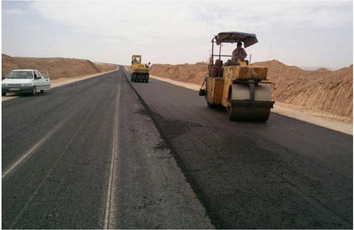
تکمیل پروژه های روکش و لکه گیری پیش از آغاز طرح نوروزی